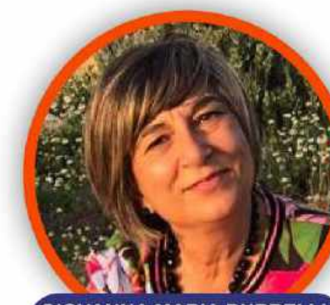
GIOVANNA MARIA BURRELLI SCUOLA PRIMARIA