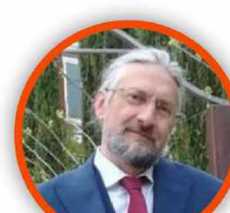
MASSIMO TAVOLA SECONDARIA DI PRIMO GRADO